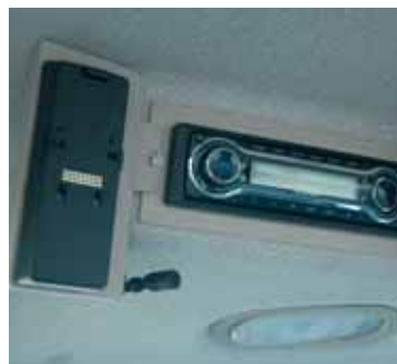
CD of CD MP3 radio

De Fendt configurator op Internet: Hier kunt u uw geheel individuele Fendt volgens eigen wensen samenstellen. Kijk op www.fendt.com .