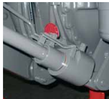
Hydraulische zijdelingse trekstangenstabilisatie