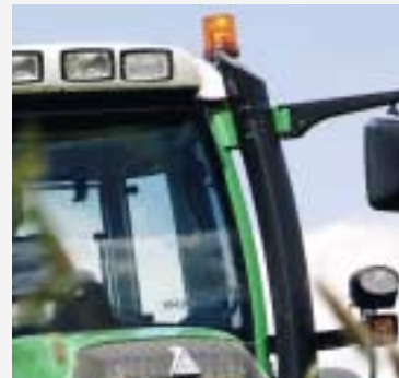
Extra verlichting met Xenon schijnwerpers; Rondomverlichting