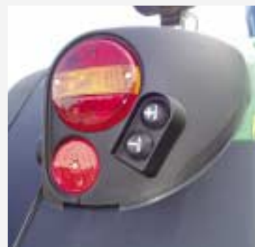
Externe bediening regelventiel achter