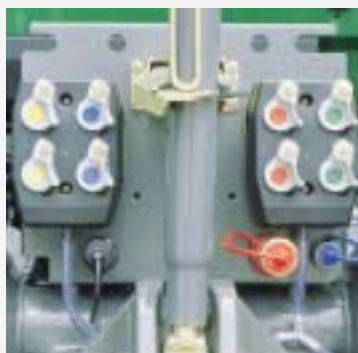
DUDK-koppelingen; Externe hydrauliekaansluiting (Load-Sensing)