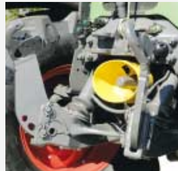
Geïntegreerde fronthefinrichting en frontaftakas