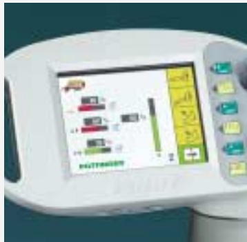
Variotronic werktuigenbediening voor bediening van ISO- en LBS-werktuigen