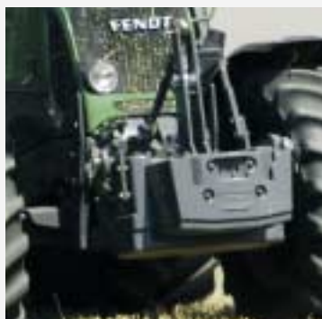
Breed assortiment gewichten voor optimale ballastering