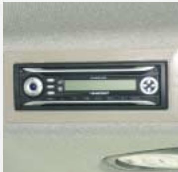
CD of CD MP3 Blaupunkt radio

■ = Standaard □ = Optioneel - = niet mogelijk